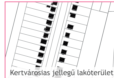
Kertvárosias jellegű lakóterület