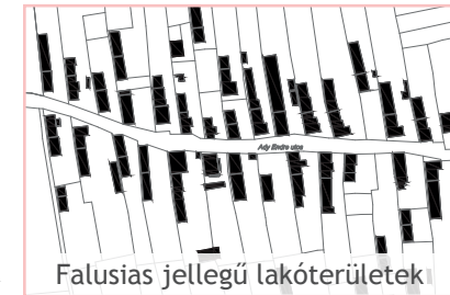
Falusias jellegű lakóterületek