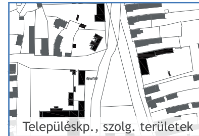
Településkp., szolg. területek